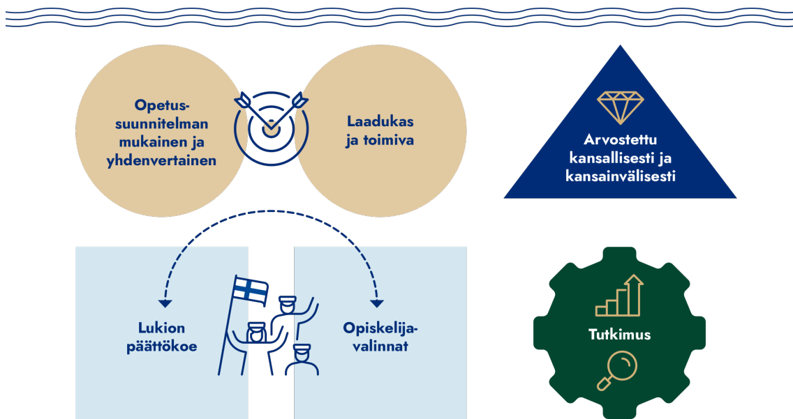
Kuva 1: Hahmottelu jatkuvasti kehittyvästä ylioppilastutkinnosta.